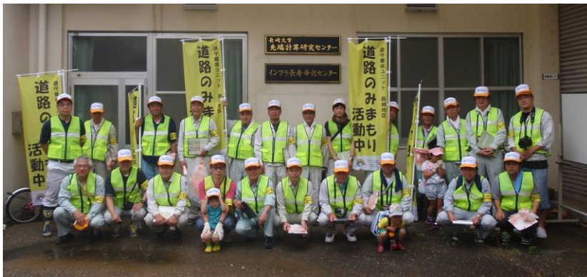
参加したみんなで集合写真