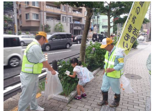
ボランティアの様子