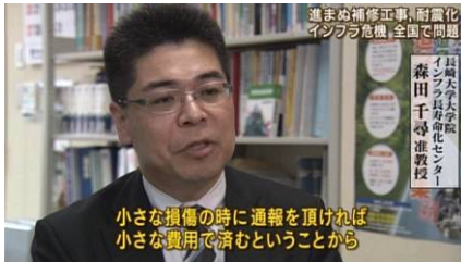
森田先生へのインタビュー